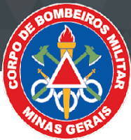
TABELA DE TAF PARA ADMISSÃO AO CFSd BM e CFSd Especialista